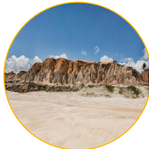
Morro Branco, Ceará