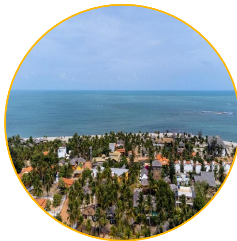
Cajueiro da Praia, Piauí