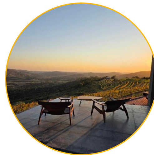
Espírito Santo do Pinhal, São Paulo