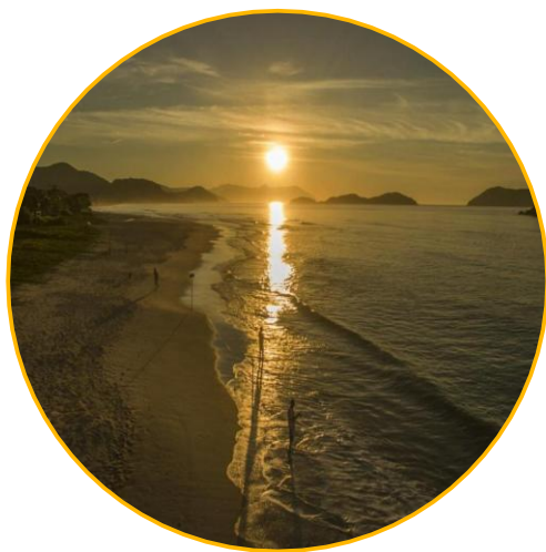
Juquehy, São Paulo