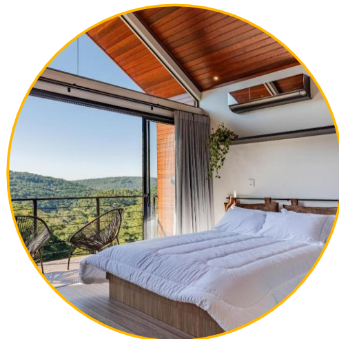
Encantado, Rio Grande do Sul