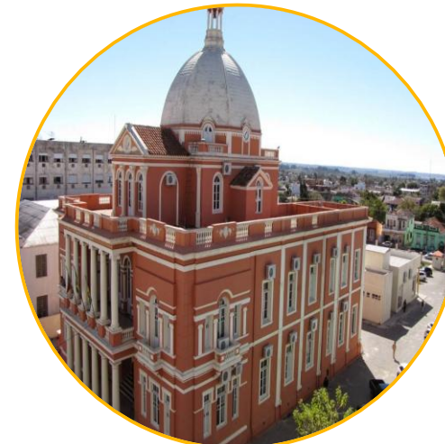
São Gabriel, Rio Grande do Sul