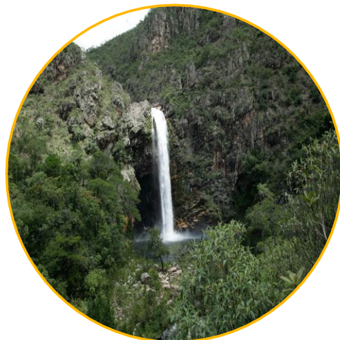
Serra da Canastra, Minas Gerais