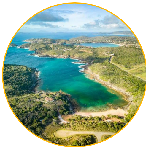
Búzios, Rio de Janeiro